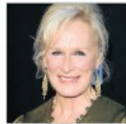
Glenn Close, el pasado junio

Glenn Close, cinco veces candidata al Oscar, recibirá en septiembre el premio Donostia del festival de San Sebastián en reconocimiento a su carrera. La actriz (64) será homenajeada el 18 de septiembre con ocasión de su visita a la capital donostiarra para presentar su última película, Albert Nobbs —en la que hace un papel de hombre—, dirigida por Rodrigo García, y que se proyecta fuera de concurso en la 59.ª edición de la principal cita cinematográfica de España.