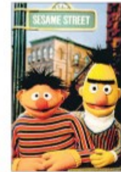
La famosa pareja de marionetas

Los seriales más populares son un folletín libanés que narra las peripecias de la vida de la gran cantante Sabah, a punto de cumplir cien años; o la historia sentimental de un hombre y una mujer de la clase media damasceña, Al Gufran (La pasión), en su título. Los telespectadores se quedan en vela para conocer su desenlace, hasta bien entrada la noche en Ramadán.