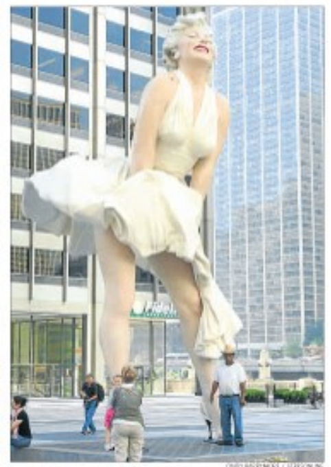
La figura de Marilyn de ocho metros origida en Chicago