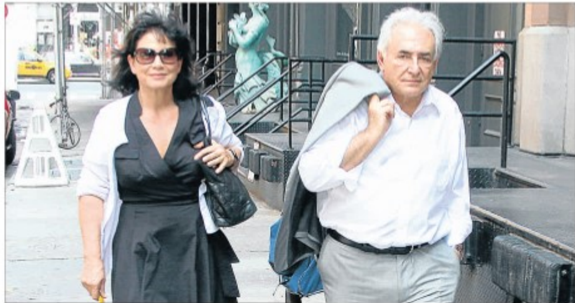
El matrimonio formado por Anne Sinclair y Dominique Strauss-Kahn, fotografiado en Nueva York, una vez que el ex presidente del FMI dejó la prisión

Sinclair, vacunada contra la vanidad —sus antiguos compañeros coinciden en subrayarlo y en elogiar a "una superprofesional"—, se paraba muy bien la vida, con un salario mensual de unos 33.000 euros, que aumentó en 1995, cuando la nombraron directora adjunta de informaciones de TFI, la cadena más vista en la Europa de la época.