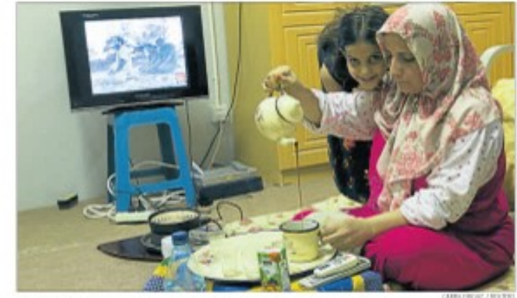
La televisión, muy presente cuando los musulmanes se alimentan en su mes sacro

Glenn Close, cinco veces candidata al Oscar, recibirá en septiembre el premio Donostia del festival de San Sebastián en reconocimiento a su carrera. La actriz (64) será homenajeada el 18 de septiembre con ocasión de su visita a la capital donostiarra para presentar su última película, Albert Nobbs —en la que hace un papel de hombre—, dirigida por Rodrigo García, y que se proyecta fuera de concurso en la 59.ª edición de la principal cita cinematográfica de España.